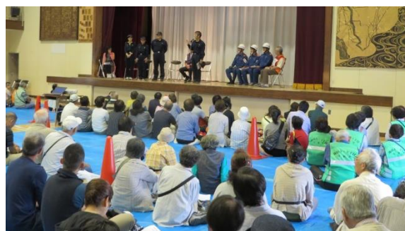
昨年の避難所運営訓練から