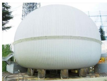
サイエンスエッグがお出迎え