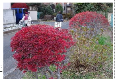
救済されたドウダンツツジ