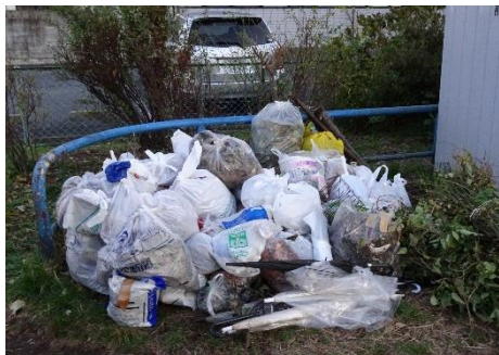
山となった回収ゴミ

植樹に先立って行われた町内一斉清掃では大小約60袋、他に5本のビニール傘、ゴムタイヤ、板切れ等を回収。分別不能で、受け