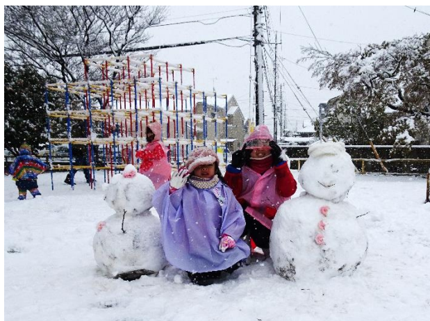
つばき公園で雪だるま（3月29日）

（なお、2018年4月1日以降に誕生された赤ちゃんはすべて給付の対象になります。漏れている方がいらっしゃれば遠慮なくご連絡ください。）