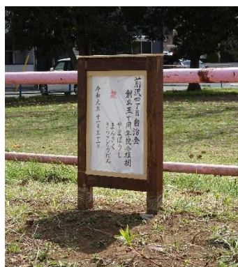
50周年記念植樹の表示板ができました（3/20）