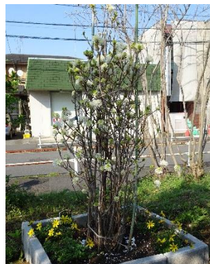
記念植樹のマンサクの花が咲きました（4/2）