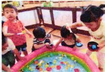
イメージ「おもちゃすくい」