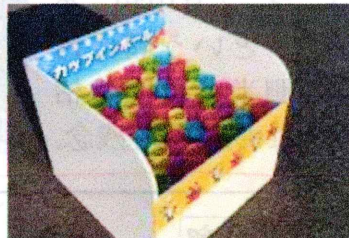
イメージ「カップインボール」