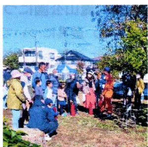
初めて持つ消火器

11月19日、つばき公園での防災訓練といざというときの安否確認訓練を実施しました。今年の訓練は消防署指導の①初期消火訓練(消火器、スタンドパイプ)、②応急救護訓練(心肺蘇生、AED)、③煙体験と、黄色いハンカチ作戦による避難行動要支援者の安否確認訓練、自治会の防災備品の操作・使用訓練。子供たちは防火服を着たり消防自動車の運転席に座って記念写真。