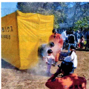
煙で目が開けられない