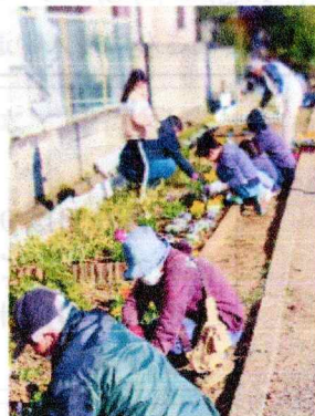
きれいに植えました