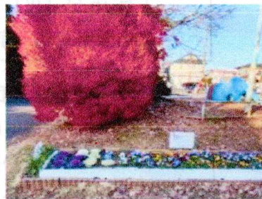
ドウダンつつじと花壇

を背に、市から提供されたビオラなどを植え付けました。遊歩道北側（5地区部分）でも有志で手入れしていただいた花壇がきれいになりました。5月頃まで楽しめます。